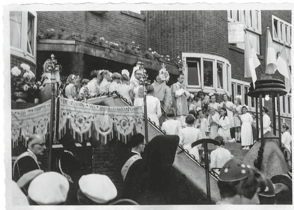
Sacramentsprocessie. Huize Sint-Vincentius gold als een modelinstelling voor het zwakzinnigenonderwijs, maar het allerbelangrijkste achtten de zusters een goede godsdienstige vorming. Hier begint de processie vanuit het hoofdgebouw, de meisjes zijn gekleed als bruidje, ca. 1958. (Archief DMJ)

De zusters in Udenhout (en in gemeenschappen elders) waren, schamper gezegd, niet alleen melkkoe maar ook koelie. Zo waren er in 1939 maar liefst 56 zusters werkzaam op Vincentius. Omdat school en internaat een geheel vormden, waren zij dag en nacht beschikbaar voor de kinderen. Net als moeders van een groot gezin moesten zij menigmaal na een drukke dag 's nachts uit bed om een kind te helpen. Tijdens de oorlogsjaren hadden zij het minder druk omdat er noodgedwongen ook minder leerlingen waren, maar in de jaren vijftig telde Vincentius alweer 200 à 250 interne en – steeds meer – externe leerlingen.