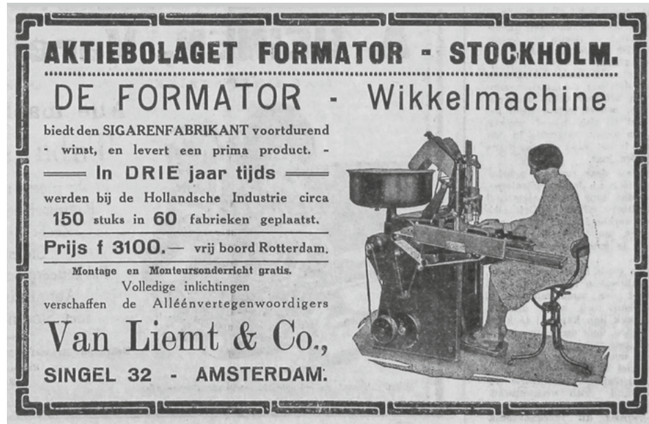
Een advertentie van een wikkelmachine. ( De Tabaksplant , 24 februari 1931)

In de loop van 1946 waren alle nog bestaande sigarenfabrieken weer in bedrijf – zij het op laag niveau. Maar Tabel 2 laat ook zien dat een fors deel van de in 1939 nog actieve bedrijven inmiddels definitief gesloten was. De oorlog had diepe sporen getrokken. Maar de mechaniseringsgolf in de jaren vijftig en zestig zou nog grotere gevolgen voor de industrie hebben omdat het gros van de fabrikanten om diverse redenen niet mee kon of wilde in deze ontwikkeling en de deuren alsnog moest sluiten.