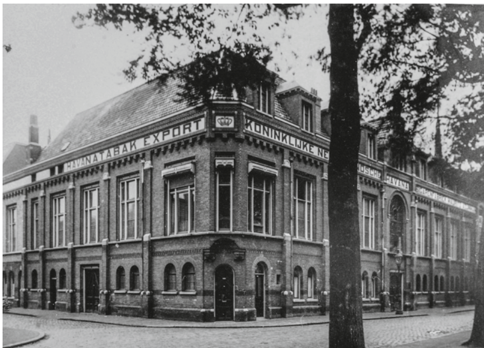
De NV Nederlandsche Havana Sigarenfabriek v/h Mauritz Azijnman in 's-Hertogenbosch (1925).