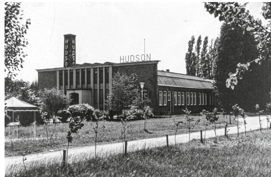
De Hudson-sigarenfabriek in Roosendaal.

De conclusie is dat de positie van de Nederlandse sigarenindustrie tijdens de Tweede Wereldoorlog nog meer verslechterde dan in de jaren dertig al het geval was. De sterke afhankelijkheid van overzeese tabakken, de tijdens de bezetting genomen maatregelen – zoals de tabaksquotering en de samenstelling van de rantsoenen – maakten in combinatie