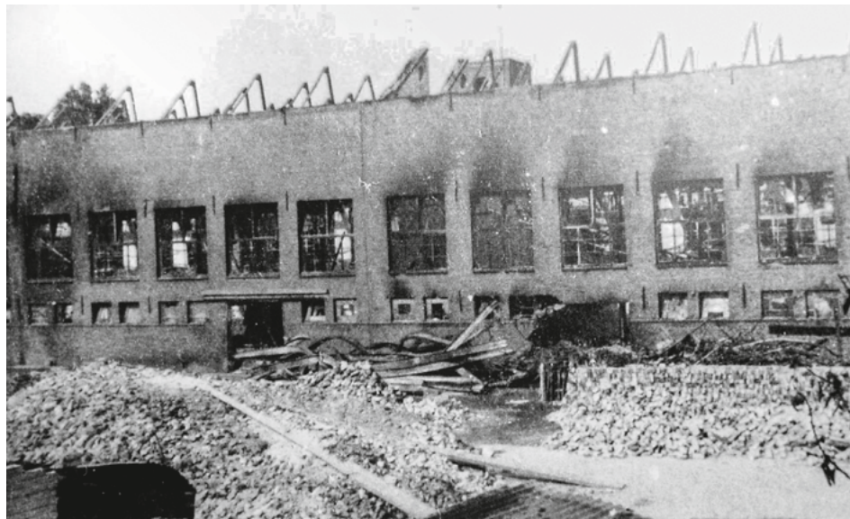
De Willem II-gebouwen in Valkenswaard na het verwoestende bombardement op 17 sept 1944.