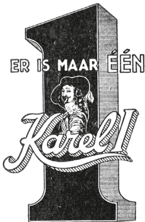
Advertentie Karel I (1933).

1916 bedroeg het Noord-Brabantse aandeel in het totale aantal werknemers in de sector nog 37 procent, maar in 1939 was dat gestegen tot ruim 54. Het Noord-Brabantse aandeel in de nationale sigarenproductie in dat jaar hield met 55 procent daarmee gelijke tred. 24 Oorzaken van deze geografische verschuiving moeten worden gezocht in het doorgaans lagere loonniveau en de in deze provincie ruimschoots aanwezige kennis van tabak, productiewijze, verkoopkanalen en dergelijke. Maar ook heeft goed ondernemerschap een belangrijke rol gespeeld, zeker als wordt gekeken naar de rol die het grootbedrijf speelde in Noord-Brabant. Dat was in 1939 goed voor 81 procent van de werkgelegenheid aldaar, substantieel meer dan in de rest van het land waar het aandeel van het grootbedrijf bleef steken op 54 procent. Eenzelfde fors verschil gold voor het gedeelte dat (half)gemechaniseerd werd geproduceerd. In Noord-Brabant was dat 84 procent tegenover 68 daarbuiten. 25 Van de dertig fabrieken met ten minste tweehonderd werknemers stonden er in 1939 zestien in Noord-Brabant, terwijl dat laatste ook gold voor drie van de vier fabrieken met meer dan duizend personeelsleden, te weten Karel I in Eindhoven, en Willem II en Hofnar in Valkenswaard. Het kwartet werd gecompleteerd door de Ritmeester-sigarenfabriek in Veenendaal. 26