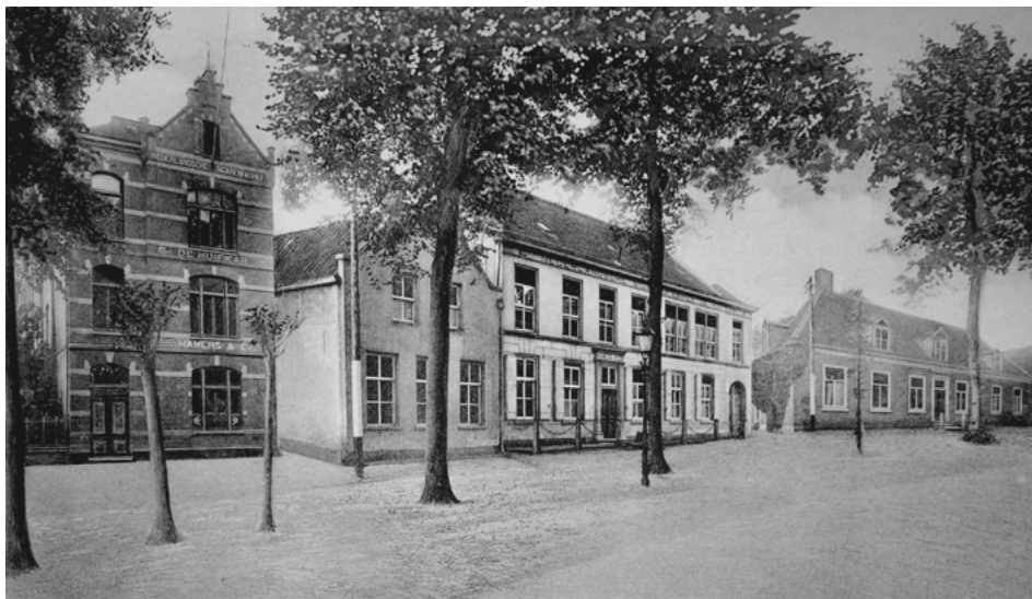
Sigarenfabriek De Huifkar in Oisterwijk. (uit: J.K. Mercx, Noordbrabant's Nijverheid in beeld , 1918)

De 42 sigarenfabrieken die na 1 april 1943 mochten blijven produceren behoorden op basis van hun productie in 1939 tot de grootste fabrieken van het land, op twee uitzonderingen na: De Huifkar in Oisterwijk die in 1939 qua productie feitelijk op plaats 53 stond en Hoefnagels in Valkenswaard op plaats 82. De Huifkar werkte tijdens de oorlog onder Duitse protectie op basis van volmachten die Huifkar-eigenaar Alphonse Hamers bij sigarenliefhebber rijksmaarschalk Hermann Göring had losgekregen. 59