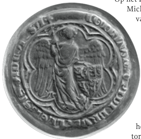
8. Zegel van Brussel uit juli 1374. ARA, VZ inv.nr. 35722.

ook in Antwerpen en Brussel werd het wapen van de Brabantse dynastie uit de eerste helft van de veertiende eeuw in het zegel opgevoerd.