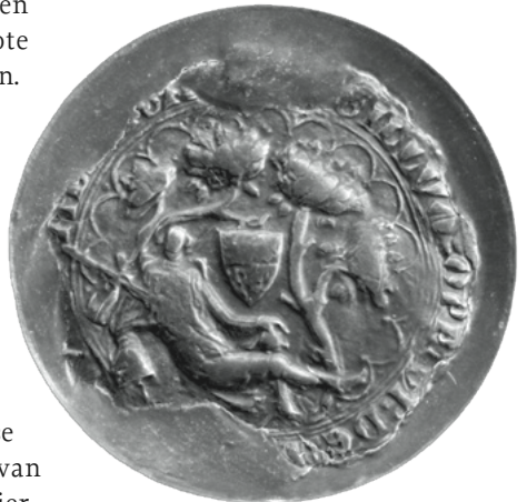
7. Zegel van 's-Hertogenbosch uit april 1375. ARA, VZ inv.nr. 26158.

Ook op het zegel van 's-Hertogenbosch is die band met het territorium duidelijk zichtbaar. 's-Hertogenbosch gebruikte in ieder geval sinds de dertiende eeuw een zogenoemd sprekend wapen op het zegel: een grote gebladerde boom geflankeerd door twee kleinere bomen. In de tweede helft van de veertiende eeuw veranderde dit in een meer figuratieve voorstelling: een geharnaste ridder ligt tussen een aantal bomen, leunend op zijn helm met in zijn rechterhand een geheven zwaard. Vlak boven hem bungelt het wapen van de hertogen van Brabant en Limburg aan een van de takken (afb. 7). Deze ridder in ruste zou de stichter van de stad verbeelden, mogelijk verwijzend naar hertog Hendrik I (ca. 1165–1235) die 's-Hertogenbosch stadsrechten verleende. 77 Volgens een zestiende-eeuwse kroniek had de stad zelfs exclusief toestemming van hertogin Johanna gekregen om het wapen met de vier leeuwen te mogen voeren. 78 Dit klopte natuurlijk niet: