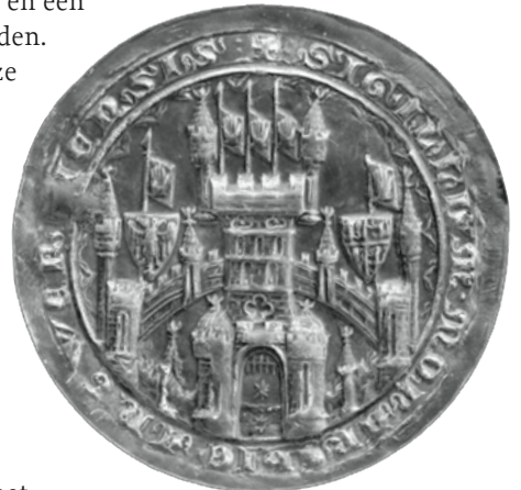
6. Zegel van Antwerpen uit september 1339. ARA, VZ inv.nr. 28230.

Uit dit voorbeeld blijkt dat er veel onduidelijkheid was en is over de manier waarop steden eigenlijk aan hun heraldische tekens kwamen. Was het de vorst die deze wapens toewees of ontwierpen de steden die op eigen initiatief? In het geval van de incorporatie van hertogelijke heraldiek, ging het dan om toe-eigening of juist om een verleende gunst? Het voorbeeld van Antwerpen uit de inleiding toont aan hoe nauw verbonden de stedelijke heraldiek was met de ontstaansmythe van stad en hertogdom. Door middel van Brabo kreeg de stad zelfs Romeinse wortels toebedeeld. In de Alderexcellentste cronyke , gedrukt in Antwerpen (1498), staat dan ook expliciet dat Caesar het wapen aan de stad verleende: ‘een borch van zelve in een velt van kelen, ende oeck twee handen, omdat Brabon die hant werp’. 74 Op zegels van de stad uit de dertiende eeuw is inderdaad een imposante burch te zien met toegangspoort, muren en een centrale toren met in de top drie banieren met handen. Sinds het einde van de dertiende eeuw werden deze geflankeerd door twee wapenschilden, het een met daarop een dubbelkoppige adelaar, het andere met het wapen van Brabant en Limburg. 75 Opnieuw werd een typisch symbool van stedelijke autonomie gecombineerd met een vorstelijk wapen, het ene verwijzend naar het hertogdom en het andere naar het markgraafschap. 76 De wapens werden bekroond met een banier met opnieuw een hand erop, waardoor de etymologische verklaring van de naam van de stad nog eens werd benadrukt (afb. 6).