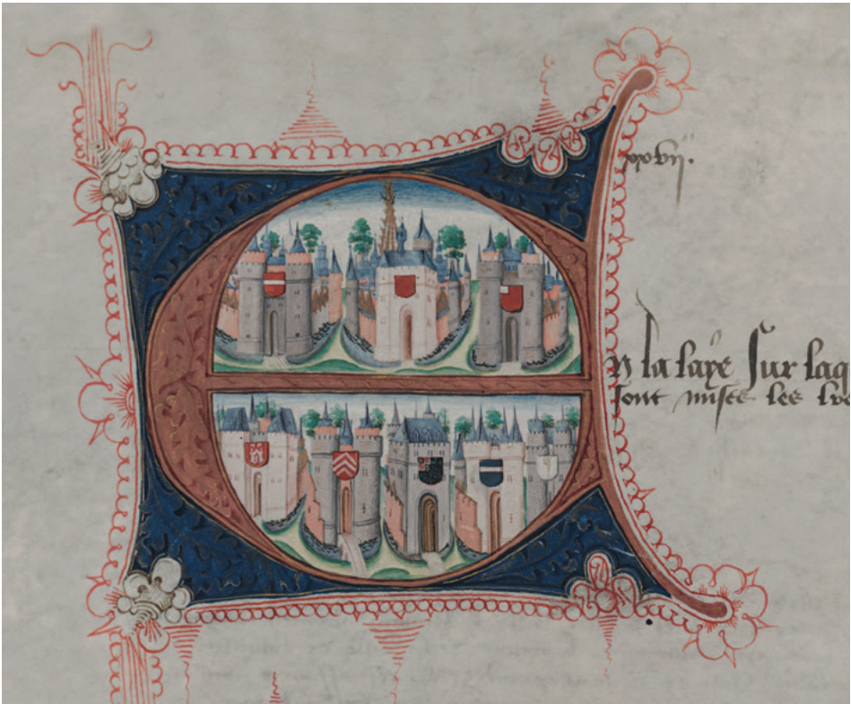
5. Zeven Brabantse stadspoorten met wapenschilden. ARA, Inventarissen Tweede Afdeling, inv.nr. 66 fol. 47r.

De opstellers van de lijsten noemen voor ieder vorstendom eerst de steden, waarna wordt afgesloten met de beschrijving van het wapenschild van het vorstendom (alleen in het manuscript uit de British Library met een daadwerkelijke afbeelding) en de bijbehorende historische wapenspreuk, in het geval van Brabant, Louvain au riche duc (afb. 4). 55 Hier verwijst de wapenkreet naar een historisch deel van het territorium dat een speciale plaats inneemt voor de dynastie: voor Brabant werd 'de machtige hertog' ( riche in deze context) aan Leuven gelieerd, verwijzend naar het gelijknamige graafschap dat de basis vormde voor het latere hertogdom. Ook wapenkreten van andere vorsten waren vaak verbonden met het territorium. Het kon bijvoorbeeld gaan om het benoemen van het vorstendom zelf ( Bourgogne! ), de heraldische beschrijving ervan ( Flandre au lion! ), of de relatie met een beroemd wapenfeit ( Limbourg à celui qui l'a conquis! ). 56