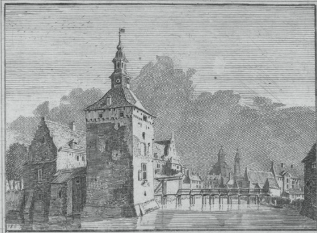
KASTEEL en STAD RAVENSTEIN.