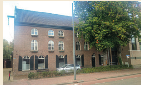
Het Huis met de klok en het naastgelegen 'auw fabriekske'.