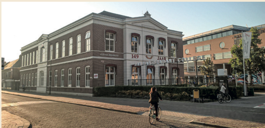
Rijksmonument Jan van Brabant College.