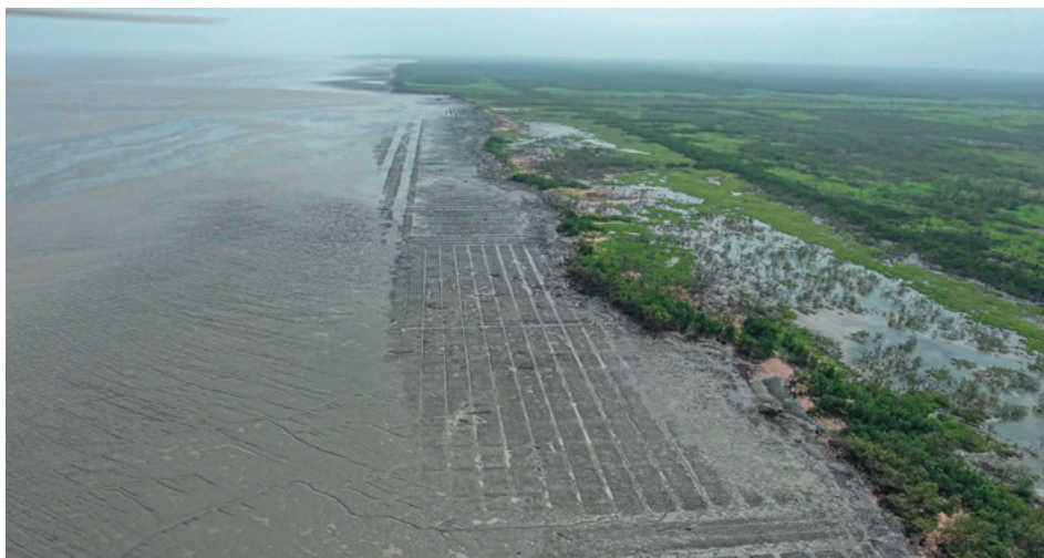
Esthersrust in 2020