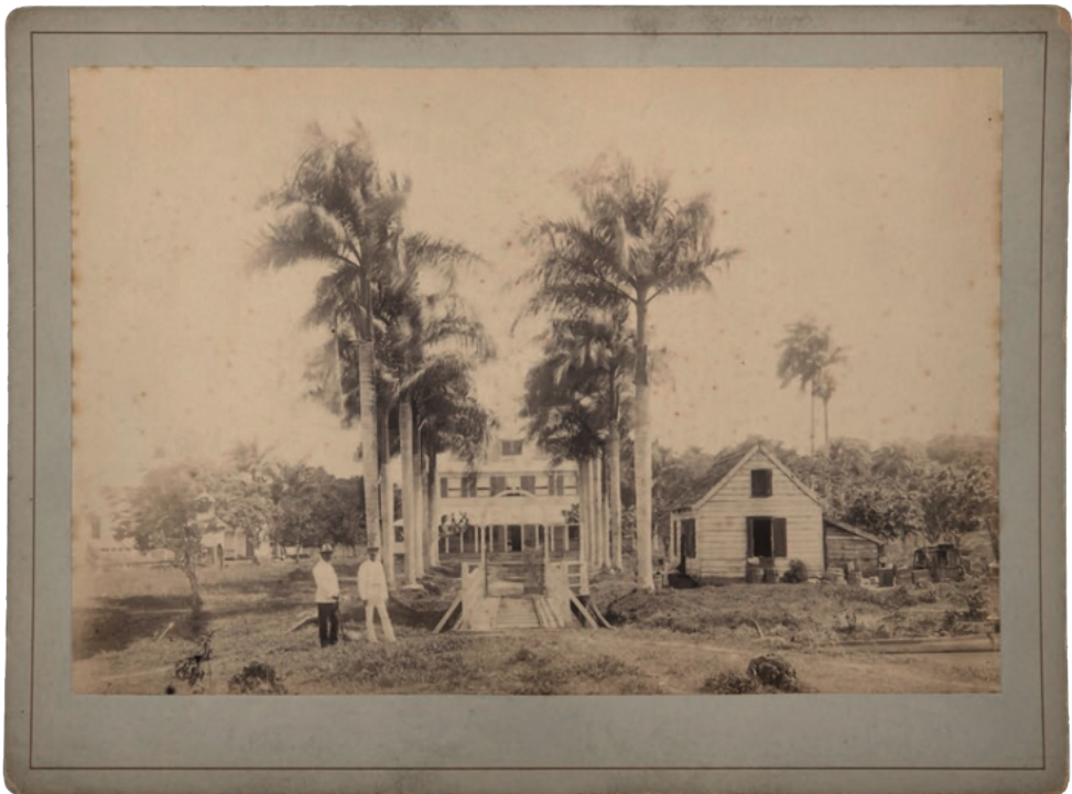
Plantage Killenstein, Albuminedruk. Wereld Museum Rotterdam.