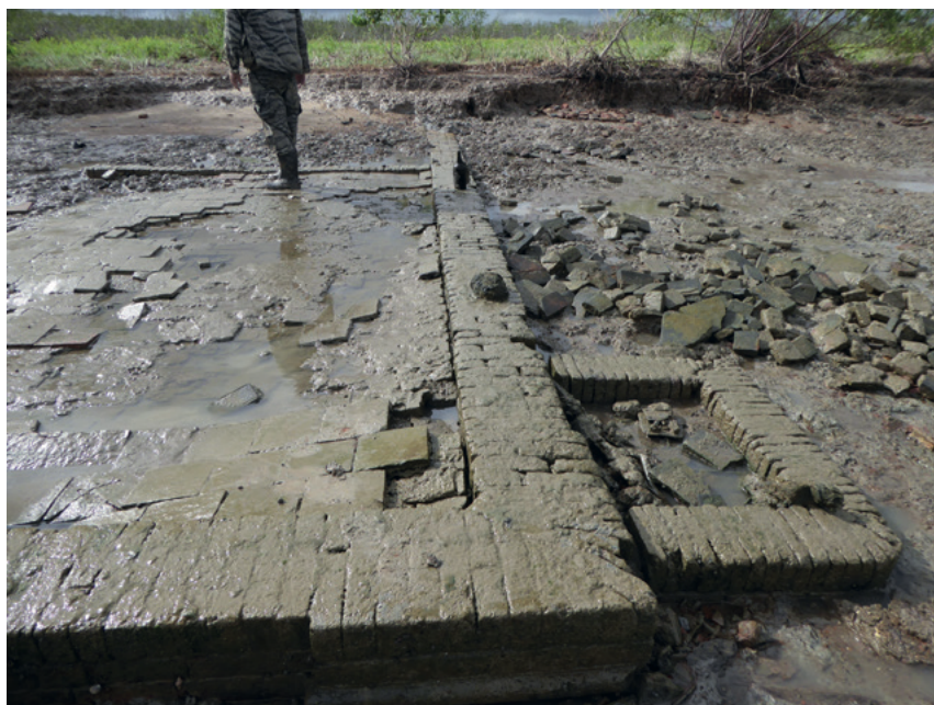
Fundering woonhuis, 2020.