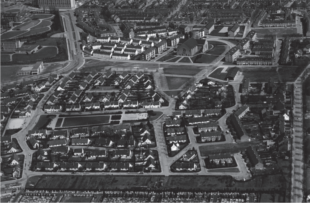
Een voorbeeld van 'katholieke planologie' uit de wederopbouwjaren: de parochie Mariaberg, Maastricht-West. Boven in beeld, achter de parochiekerk, de RK lagere scholen voor meisjes resp. jongens, genoemd naar Maria Goretti resp. Pius X, en geleid door de 'Zusters Onder de Bogen' resp. de 'Broeders van de Beyart'. Het lage gebouw rechts vóór de kerk is de eveneens door de zusters geleide bewaarschool.

kerk stond in het midden; daaromheen werden scholen en winkels gebouwd, en daar weer omheen de huizen, als in een dorp. Men sprak van 'katholieke planologie'. 5