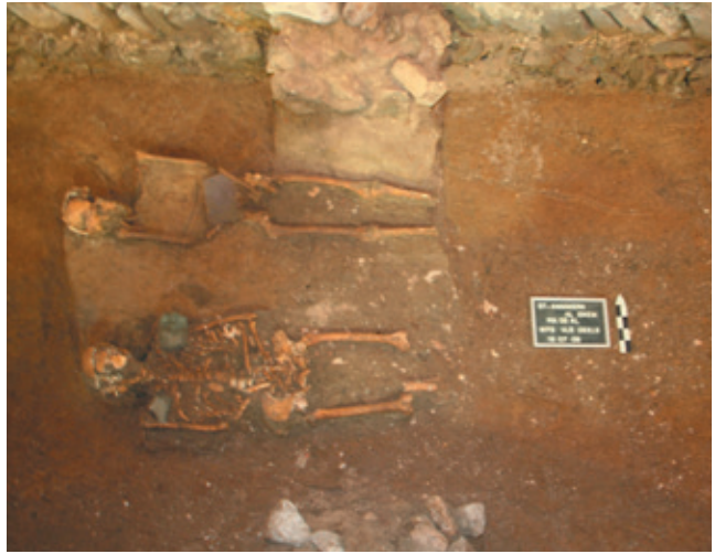
Afb. 10 Dubbele begraafing in volle grond in de noordelijke zijbeuk, Werkput 3 Vlak 5 (Musea Maaseik).

Twee andere opmerkelijke graven (afb. 10) in de noordelijke beuk van de kerk trokken de aandacht. Eigenlijk betrof het hier één graf met twee lichamen, enkel gewikkeld in een lijkwade, begraven in volle grond. Op één lichaam werden twee leistenen aangebracht op de schouders en bij het tweede lichaam werd een leisteentje aangetroffen ter hoogte van het bekken. De oriëntering daarentegen is wel geënt op de ligging van de kerk. Ook hier werd een oudere datering verwacht. 14 C-onderzoek op het skelet in 2016 zorgde eveneens voor een datering in de vijftiende - zestiende eeuw.