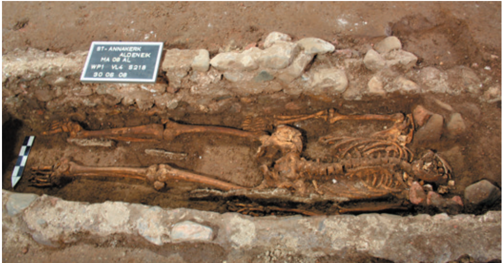
Afb. 16 Graf uit maaskeien, Werkput 1 Vlak 4 Spoor 218 (Musea Maaseik).

tiende eeuw. 29 14 C-datering van het skelet leidde tot een datering tussen 680 en 890 en kan dus mogelijk gekoppeld worden aan de Karolingische kerk.