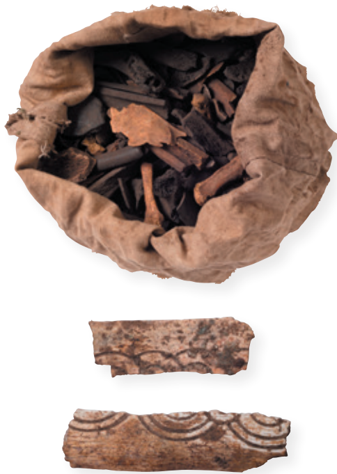
Afb. 13 Een linnen zak met verbrand botmateriaal, geitenkeutels, een pruimenpit en een naaldenkoker.

toegeschreven worden aan Harlindis en Relindis blijken aldus met een sterk vermoeden toe te wijzen aan twee personen die in de zevende eeuw geleefd hebben. Hierdoor zouden het de resten van de heiligen Harlindis en Relindis kunnen zijn. Een uniek resultaat!