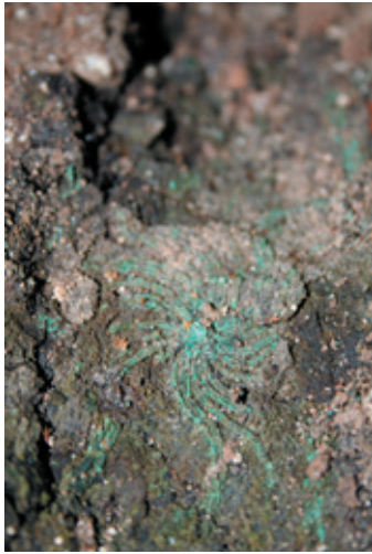
Afb. 9 Bronzen mantelspeld uit Spoor 210 – grafcontext (Musea Maaseik).