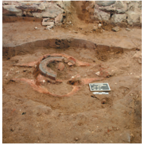
Afb. 18 Klokkenuoven, Werkput 1 Vlak 4 (Musea Maaseik).

De aanwezige westelijke muur, die duidt op een vergroting van de kerk, de ingang in de noordelijke zijbeuk en de aanwezigheid van de