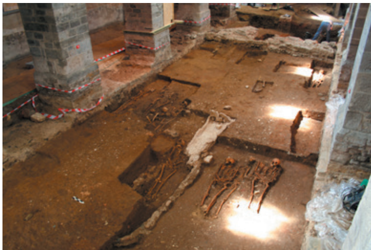
Afb. 7 Overzicht van de archeologische opgraving in de middenbeuk van de Sint-Annakerk op 14 mei 2008 (Musea Maaseik).

staat omschreven dat het portaal vergroot werd tot aan het klokkenhuis en voorzien werd van een houten zolder. De aannemer moest een venster voorzien, zo groot als deze boven de sacristie met drie ijzeren staven. De muur moest hij optrekken van 'één steen dik' van het oud portaal tot aan de 'pilaar' van de kerk. 24