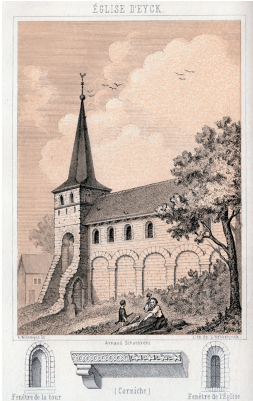
Afb. 1 Tekening Sint-Annakerk van Aldeneik door Arnaud Schaepkens uit 1861 (Rik Nulens).