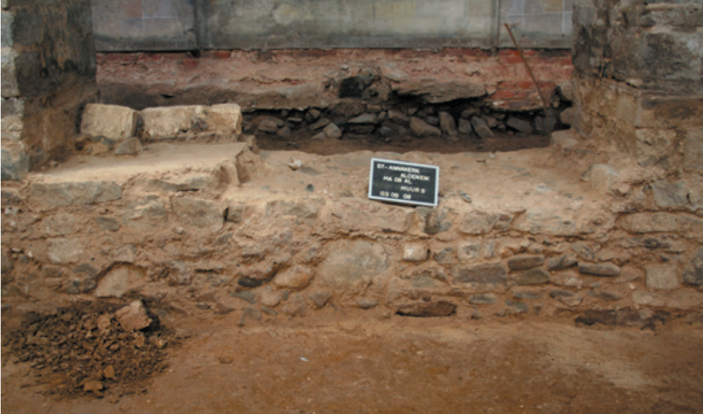
Afb. 21 Systematische uitbraaksporen in de kettingmuren tussen de pijlers van de middenbeuk van de Sint-Annakerk.

de westbouw kon archeologisch niet vastgesteld worden. Zuiver geredeneerd zou een afbraak na de ingebruikname van de westbouw plaatsvinden. De romaanse kerk bleef zo functioneel tot na de verbouwing. Pas na de aansluiting van de westbouw werd de verbouwing van de apsisen op gang gebracht. Ook hier kunnen we uitgaan van de verdere functionaliteit van de kerk en de mogelijke verhuizing van het altaar naar het koor tot de beëindiging van de werkzaamheden.