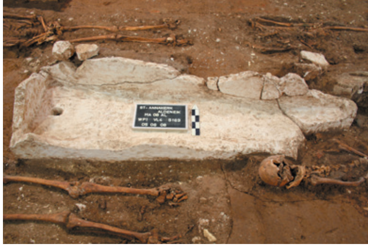
Afb. 23 Witte sarcofaag uit de zevende eeuw, Werkput1 Vlak 4 Spoor 163 (Museum Maaseik).

vergelijkbaar met andere sarcofagen in de Benelux. Dit exemplaar is echter zwaar beschadigd en het deksel ontbreekt. De steenkapper heeft gewerkt van de voet naar het hoofd met een polka van 4 cm. Aan het hoofd heeft hij in twee richtingen gewerkt.