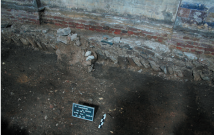
◀ Afb. 14 Fundering noordelijke buitenmuur, Werkput 3 Vlak 4 (Museum Maaseik).