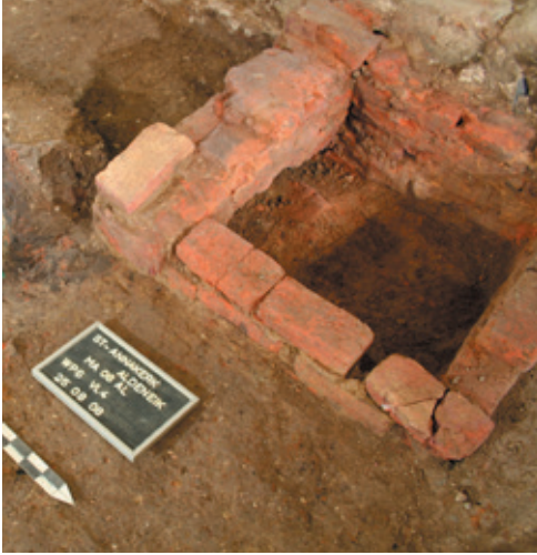
Afb. 19 Smeltoven voor het brons van de romaanse klok, Werkput 6 Vlak 4 (Musea Maaseik).