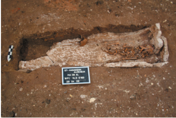
Afb. 22 Witte sarcofaag uit de zevende eeuw met kind uit de dertiende eeuw, Werkput 1 Vlak 4 Spoor 163.

De altaren dateren uit de vijftiende eeuw. De aanleiding voor de uitbraak was de verhuis van het Kapittel naar Maaseik in 1571. Ook de zijbeuken en de westbouw werden op dat moment afgebroken en pas in de negentiende eeuw gereconstrueerd door architect Jaminé.