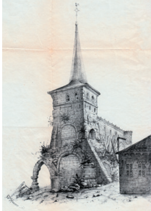
Afb. 6 Tekening van de Sint-Annakerk door Guillaume Hennen uit de negentiende eeuw voor de restauratie door architect Jaminé (Rik Nulens).

Een kantelmoment situeert zich op 22 maart 1571 wanneer er wordt beslist om het kapittel te verhuizen naar Maaseik, gecombineerd met een translatio onder leiding van suffragaanbisschop Gerard van Groesbeek (1565-1580). 22 Alle religieuze objecten, inclusief de relieken van Harlindis en Relindis, de Codex Eyckensis en de Angelsaksische textilia werden overgebracht naar de Sint-Catharinakerk van Maaseik. De aanleiding voor de verhuizing was de dreiging van de calvinisten. 23 Twee kerken werden te veel voor het gehucht Aldeneik. Men besloot om drastische wijzigingen in te voeren wat leidde tot de afbraak van de parochiekerk. Daarnaast werden de kloostergang, de zijbeuken en de westbouw van de oorspronkelijke