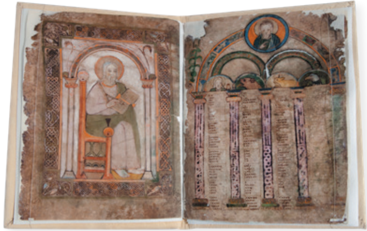
Afb. 2 Codex A met één volbladminiatuur en enkele overgebleven canontafels.

een combinatie is van twee onvolledige evangelia , 6 die vermoedelijk in de twaalfde eeuw samengevoegd werden. Dit is af te leiden uit de aanwezigheid van twee reeksen canontafels. Sinds 2015 tot op heden loopt er een uitgebreid internationaal onderzoek. 7 Een onderzoek dat hopelijk meer duidelijkheid kan verschaffen over de herkomst van de twee evangelia en hun datering. Eén van de elementen die opnieuw in vraag wordt gesteld is of de evangelia op het Europese vasteland of op Angelsaksische bodem zijn vervaardigd. Een vervaardiging van de Codex Eyckensis door de heiligen Harlindis en Relindis is bijgevolg vrij onwaarschijnlijk.