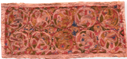
Afb. 3 Detail van de Casula, meer bepaald een zicht op de Angelsaksische medaillons (Museum Maaseik).