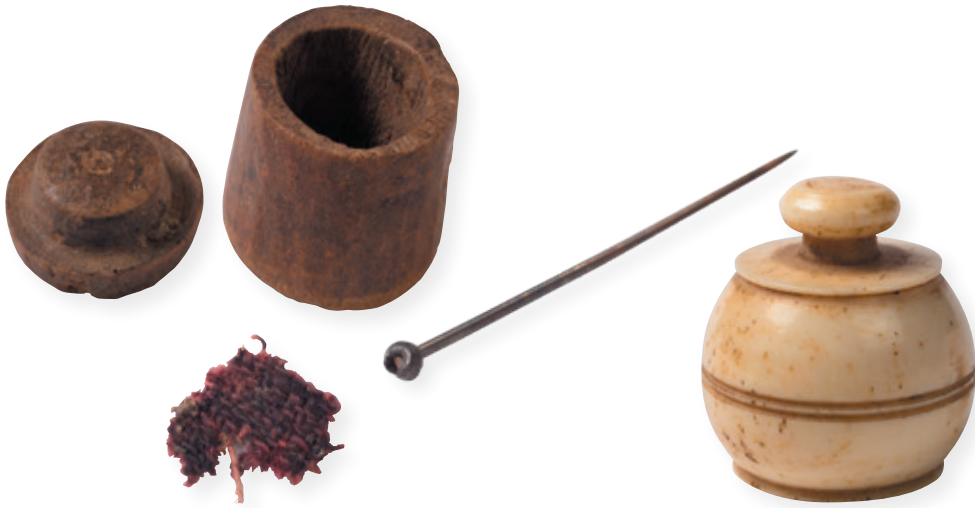
Afb. 11 Houten container, weefselfragment, mantelspeld en ivoren container (KIK-IRPA, Brussel).

In beide reliekkisten werden enkele voorwerpen aangetroffen die dateren uit de zevende eeuw, gebruiksobjecten die bijgevolg niet aan een vermoedelijke reliekenhandel gekoppeld kunnen worden. Het gaat hier om een kleine houten container ( ^{14}\text{C} -datering: zevende eeuw), een zwart-paarsachtig weefselfragment met keperstructuur ( ^{14}\text{C} -datering: 760 à 900, mogelijk van een Friese mantel), een mantelspeld en een ivoren container (Afb. 11). De speld heeft een opengewerkte knop en is stilistisch terug te brengen tot de Merovingische periode.