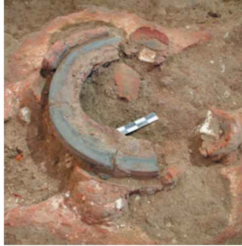
Afb. 20 Detail klokkenoven met stookkanaal en opbouw van de mal, Werkput 4 Vlak 1.

Vandaag beschikt de Sint-Annakerk ook over een luiklok in de westbouw. Deze klok dateert echter pas van de restauratiecampagne van architect Jaminé in de negentiende eeuw, maar is een reconstructie van de gotische toren en klok uit de dertiende eeuw. Dankzij de vondst van de klokkenoven tijdens het archeologisch onderzoek van 2008 kunnen we extra bevestigen dat de romaanse kerk voorzien was van een eigen toren, dus vóór de bouw van het westwerk tijdens de gotische periode. Dit is een extra bevestiging voor een volwaardig functionerende romaanse kerk.