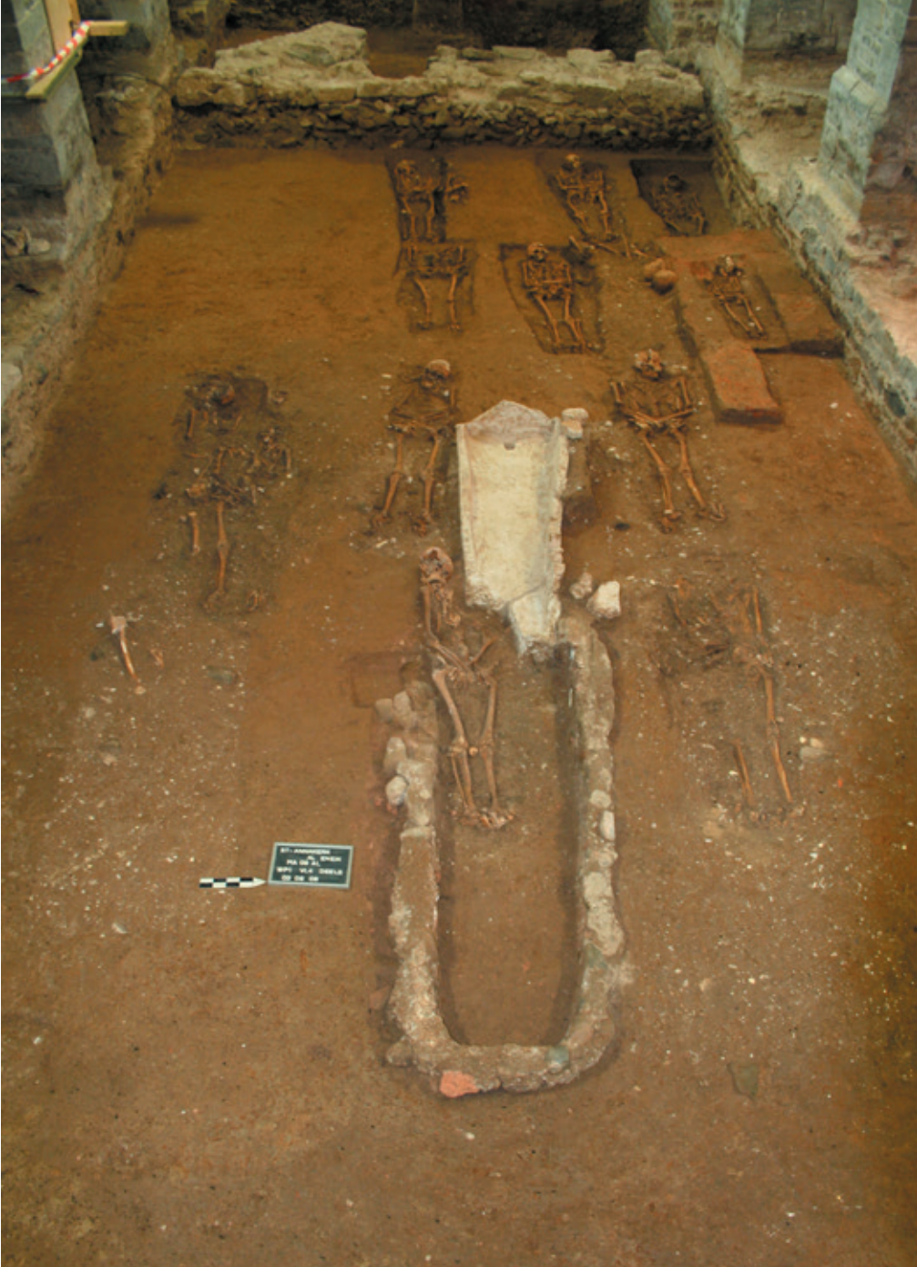
Afb. 17 Zicht op de cultuur van grafverstoringen, middenbeuk huidige Sint-Annakerk (Musea Maaseik).