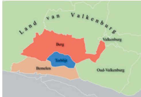
De aan Terblijt grenzende heerlijkheden, en de ligging ten opzichte van het Land van Valkenburg. Kaartontwerp: Marnix Haesen.

De oudere geschiedenis van Terblijt is grotendeels obscuur. Terblijt had geen eigen kerk, maar behoorde tot de parochie Berg. De inwoners van Terblijt hadden gebruiksrechten met betrekking tot de gemene gronden (de gemeynte ) gelegen in Berg. 1 Terblijt lijkt daarom in de middeleeuwen te zijn afgesplitst van Berg, misschien door toedoen van de heer van Valkenburg als voogd van Berg. De tienden in Terblijt kwamen niet (of niet meer?) toe aan het kapittel van Sint-Servaas, zoals in Berg het geval was. Wie er recht op had is niet bekend, behalve wat betreft het gedeelte dat toekwam aan de pastoor van Berg. De heren van Terblijt verbleven niet in hun heerlijkheid. Van een kasteel is niets bekend. De oudste vermelding van Terblijt als heerlijkheid is te vinden in een document dat dateert uit 1409. Daarin is sprake van 'Trumblyt'. 2 Heer van Terblijt was toen Christiaan van Merode, die ook heer van