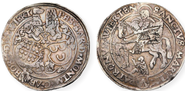
Een Martinusdaalder geslagen in Weert.

De zilveren munten zijn zeer zeldzaam. Over de oorspronkelijke aantallen zegt dit weinig. Van de overige genoemde vervalsingen zijn geen voorbeelden meer bekend. In de Nationale Numismatische Collectie bevindt zich nog een derde munt die wordt toegeschreven aan Terblijt. 28 Deze toont op de ene zijde een dubbelkoppige adelaar en op de keerzijde een ridder in wapenrusting met een banier. Het rond-schrift duidt hem aan als de heilige Martinus, maar iconografisch past dat niet. Het rond-schrift op de keerzijde luidt 'MONETA NOVA