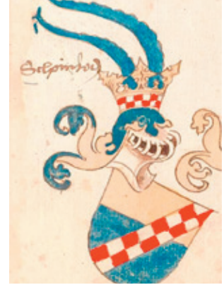
▲ Het wapen Van Schönrode zoals (vijfmaal!) weergegeven in het in het 'Bruderschaftsbuch' van de Gulikse Hubertusorde. De richting van de balk wijkt af en hier is de gouden helft van het schild boven.