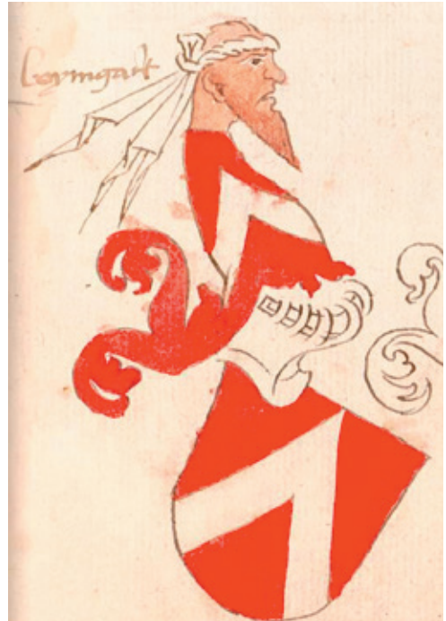
Het wapen Van den Bongart zoals weergegeven in het 'Bruderschaftsbuch' van de Gulikse Hubertusorde. Bayrische Staatsbibliothek, München: Cod.icon. 318.