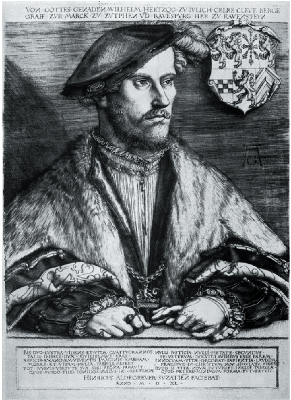
Hertog Wilhelm V van Kleef, Gulik en Berg (1516-1592) in 1540 (Publieke domein).