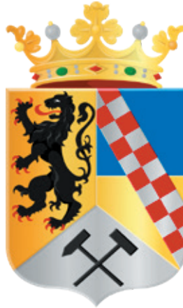
▼ Het wapen van de voormalige gemeente Eyselshoven. (Publieke domein).