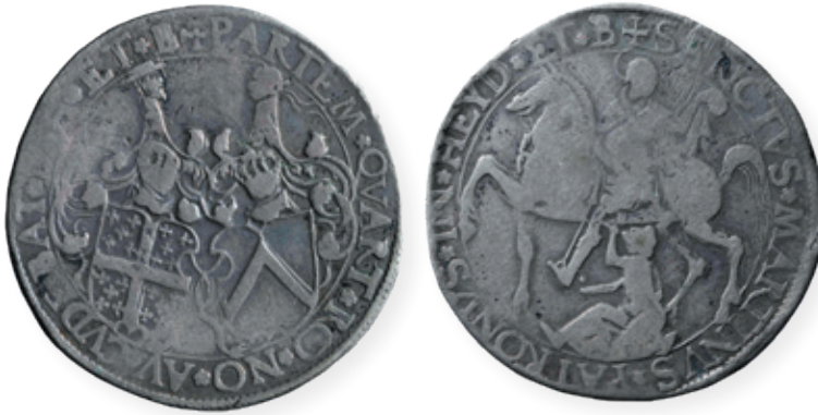
Zilveren daalder met op de ene zijde twee wapenschilden, op de andere zijde de heilige Martinus. Randschriften: PARTEM QUART RO NO CVDEBAT D H ET B en op de keerzijde SANCTVS MARTINVS PATRONVS IN HEYD ET B.

kupfferen und übergulden Münzen, silbere pfenninge, [...] auch sonst andere silbere sorten, so für ortter thalers ausgebreitet und am gehalt und gewicht vil zu geringe. Wie gleichfals ein gutte anzal kupffere kleine Müntz sorten und Meitten [...]' 27