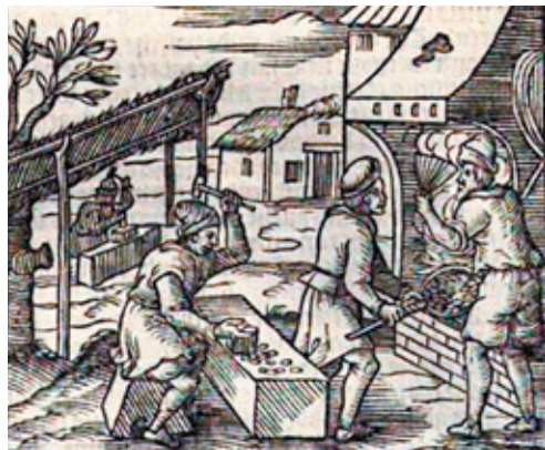
Illustratie bij het hoofdstuk 'Van Valsche Muntenaers' uit een heruitgave (Rotterdam, 1650) van een werk van J. de Damhouder, Practycke in criminele saken .

De overheden keerden zich in toenemende mate tegen alle 'wilde' muntslag en probeerden de kwaliteit van de in omloop zijnde munten te bewaken. Zowel door het Rijk als door de land-