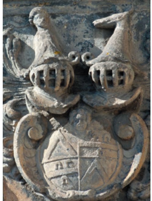
Wapen, afkomstig van het huis Heyden, nu aangebracht aan de kerk van Horbach. Het dateert van rond 1600. Het wapen Van den Bongart is in het gevierendeelde schild gecombineerd met het eerdere wapen van de Van den Bongart als eigenaren van het huis Heyden.