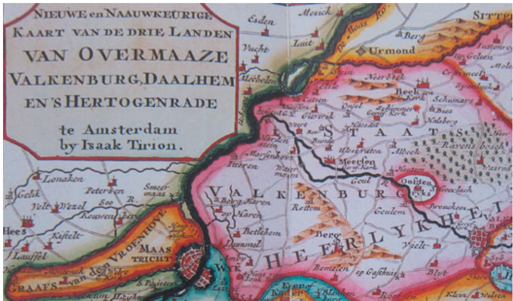
Kaart van Tirion (eerste helft 18de eeuw): 'Blyt' (rechtsonder) als onderdeel van Staats Valkenburg getekend. RHCL, Kaartencollectie, nr. KP 42a.

gaan, werd nog lang getolereerd. 16 Pas in 1772 klaagde het Staats Leenhof van Valkenburg bij de Staten-Generaal dat in Terblijt de bevoegdheid van het Leenhof in civiele zaken in appel, zoals die in het hele Land van Valkenburg gold, niet werd erkend. 17 Dat kreeg niet direct een vervolg. Maar in 1779 wilde een inwoner van Bemelen bij het Leenhof van Valkenburg in appel gaan tegen een vonnis van de schepenen van Terblijt. De schepenen van Terblijt wilden dit niet toestaan en stelden dat de schepenstoel van Aken appellinstantie was. Maar zij wezen de soevereiniteit van de Staten-Generaal niet af en gehoorzaamden aan een bevel om de executie van hun vonnis op te schorten. Een rekest van de veroordeelde aan de Staten-Generaal leidde ertoe dat de beslissing over de rechtsgang in hoger beroep werd overgelaten aan de Raad