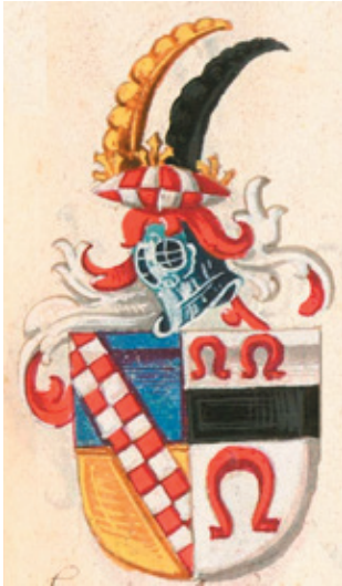
▲ Wapen van een 'Herr von Schönrodt, Herr zu Heiden' zoals weergegeven in Conrad Grünenberg's Wappenbuch , waarvan de oudste versie uit 1483 dateert. Bron: Bayerische Staats Bibliothek, Cgm 9210.