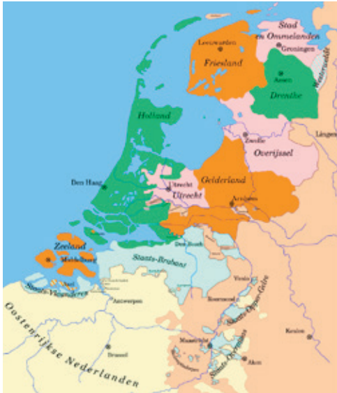
Afb 1 Republiek der Zeven Verenigde Nederlanden.

een evenredige samenstelling van schepenen en andere functionarissen, de stad moest besturen. Het verschil in godsdienst leidde regelmatig tot tweedracht binnen deze Indivieze Raad, zoals verderop ook duidelijk zal worden. Even belangrijk, zo niet belangrijker dan het verschil in godsdienst, was hierbij het feit dat de katholieken in het bestuur en andere overheidsorganen de macht moesten delen met de gereformeerden, die slechts een minderheid van de bevolking uitmaakten. Om de twee jaar zonden de soevereinen elk twee afgevaardigden naar Maastricht, commissarissen-deciseurs genaamd, die in appèlzaken vonnis moesten wijzen, benoemingen regelen en rekeningen controleren. De stad bekostigde haar uitgaven uit eigen inkomsten. Door haar garnizoen, dat blijvend in de stad was gelegerd, was de (machts)positie van de Republiek sterker dan die van de prins-bisschop.