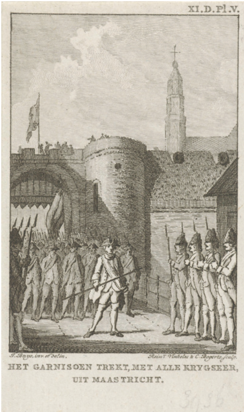
Afb 4 Het garnizoen verlaat Maastricht. Bron: Rijksmuseum, Objectnummer RP-P-OB-84.014, De uittocht met alle krijgseer van het Nederlandse garnizoen onder baron Van Aylva, na de capitulatie van de stad Maastricht aan de Fransen, 10 mei 1748. Prentmakers Reinier Vinckles en Cornelis Bogerts (beiden vermeld op object) naar tekening van Jacobus Buys.