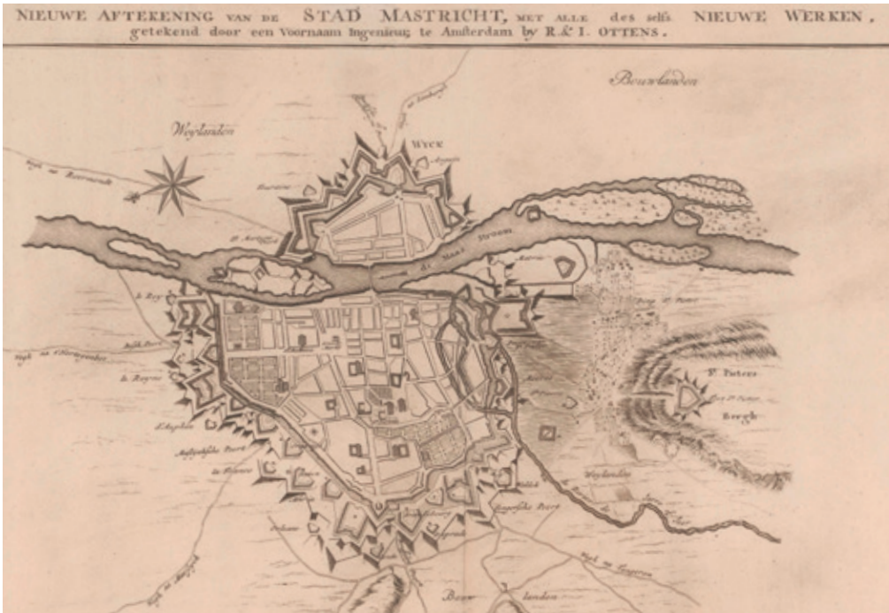
Afb 3 Plattegrond van Maastricht in 1748.

Op 21 april 1748 begonnen de beschietingen op de verdedigingswerken van de stad (afbeelding 3), die tot 7 mei zouden duren. 25 Ondanks de demarches en ‘presenten’ vielen veel bommen in de stad zelf, met name in de Boschstraat, Brusselsestraat en op het Vrijthof en het gebied dat deze straten en dit plein omsloten. Ook de Nieuwe Biesen, het klooster van de Duitse Orde dat in de noordwestelijke hoek van de stad lag, werd ernstig beschadigd. De projectielen waren afkomstig van het geschut dat ten noorden van de stad verhoogd