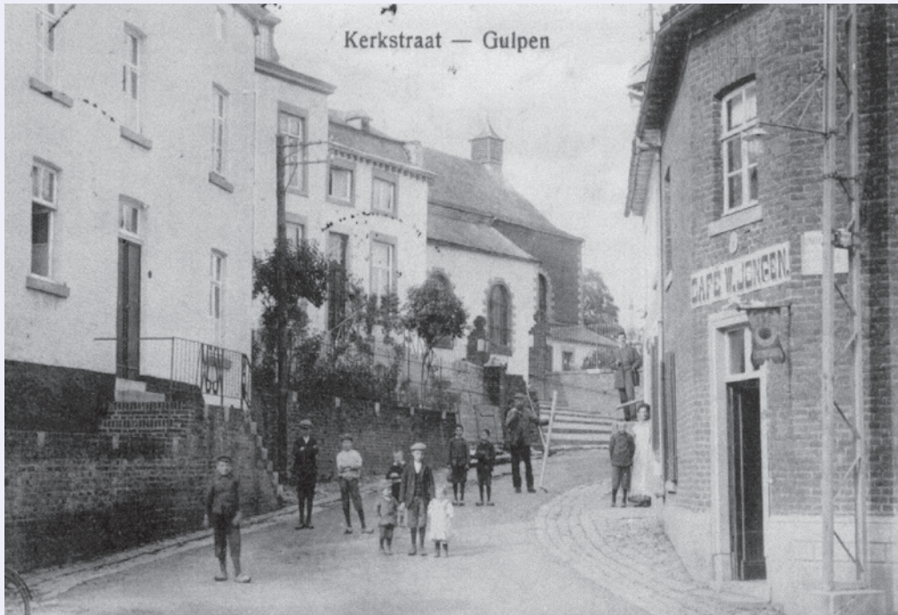
De Kerkstraat rond 1900. Het huis van Hupperts ligt rechts, net niet zichtbaar.