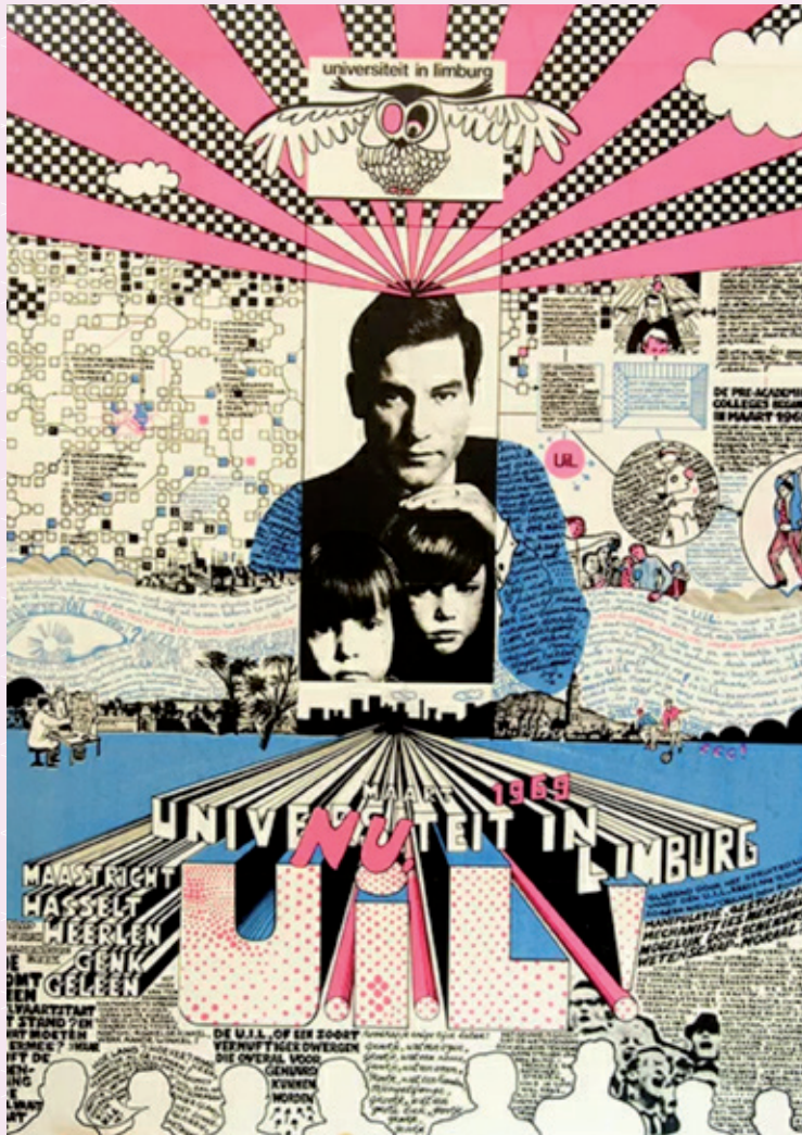
Affiche de Uil, 1969, Archief Universiteit Maastricht