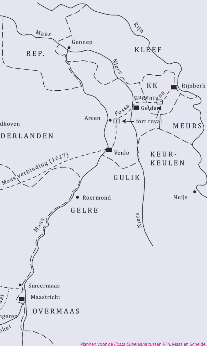
Plannen voor de Fossa Eugenia tussen Rijn, Maas en Schelde, 1626-1627.