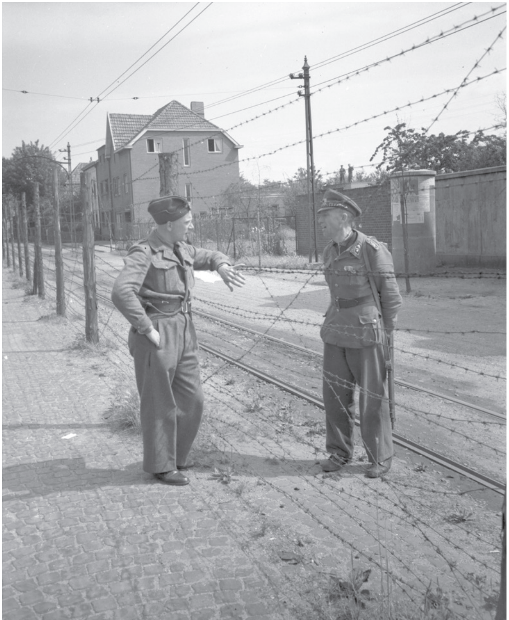
Nederlandse en Duitse douaniers aan de grens in de Nieuwstraat tussen Kerkrade en Herzogenrath. Vanaf eind 1949 kwam grensarbeid vanuit Duitsland naar Nederland weer langzaam op gang. Historisch Centrum Limburg / DSM voorlichtingsdienst (fotografieafdeling), foto 15 februari 1948. Fotocollectie DSM, PR3194. CC BY-NC-SA