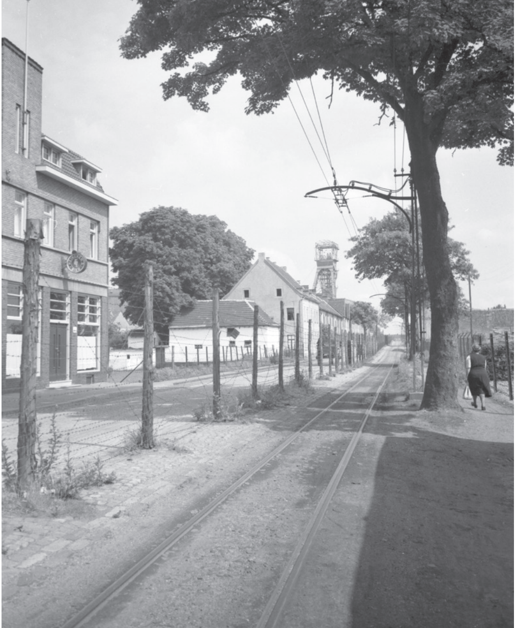
Prikkeldraadversperring aan de Nederlands en Duitse grens in de Nieuwstraat tussen Kerkrade en Herzogenrath, met achteraan links schachtbok van de Domaniale Mijn in Kerkrade. Na de bevrijding was grensarbeid tussen Duitsland en Nederland niet meer mogelijk, en waren Duitse mijnwerkers niet meer welkom in Nederlandse mijnen. Historisch Centrum Limburg / DSM voorlichtingsdienst (fotografieafdeling), foto 15 februari 1948. Fotocollectie DSM, PR3193. CC BY-NC-SA