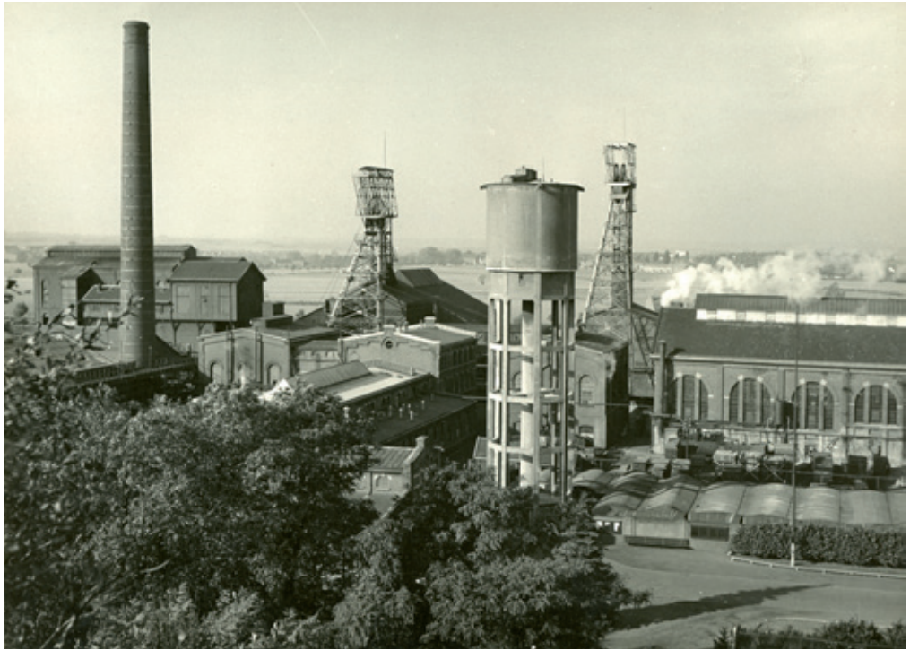
Overzicht Oranje-Nassau Mijn II in Schaesberg met de schachten I en II. In deze mijn waren tussen juni 1946 en augustus 1949 niet-bonafide Duitsers ondergronds tewerkgesteld.

meer onder beheer stonden, en de Mijn Industrie Raad anders over de arbeidsvoorwaarden voor Duitsers gingen denken. Met ingang van 1 januari 1949 werden de meest nadelige arbeidsvoorwaarden voor hen geschrapt. Zo werden ze voortaan niet meer gekort op hun inkomen en mochten ze zelf gaan uitmaken op welke mijn ze wilden werken. De negatieve definitie van Duitser bleef echter bestaan (art.1) en ze kregen geen actief en passief kiesrecht binnen de bedrijfsorganisatie (art.3). Ook konden niet-bonafide Duitsers geen ploegbaas of voorman worden. 25 Het is daarom begrijpelijk