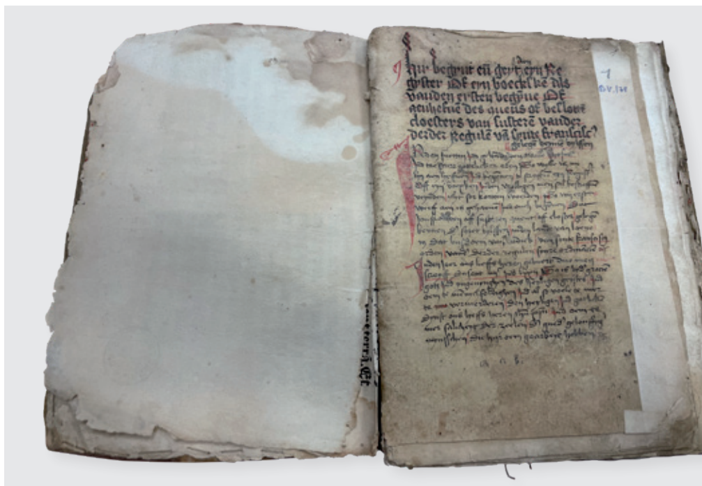
Eerste pagina van Treckpoels Kroniek van Bilzen (Hasselt, Rijksarchief, Klooster Maria-ter-Engelen, 6, Eerste deel, 1).

van Luyk – die hij aangetroffen had in een zeventiende-eeuws handschrift uit de abdij van Averbode – tot diens oeuvre. 18 Allerhande indirecte gegevens met betrekking tot de vooropleiding en het profiel van de auteur, zijn belangstelling voor de streek rond Maastricht, Sittard, Beek en Bilzen, en de talrijke passages die vrijwel identiek zijn aan de corresponderende passages in de andere historiografische teksten van Treckpoel, laten er nauwelijks twijfel over bestaan dat het inderdaad om een vierde werk van de Beekse priester gaat. 19