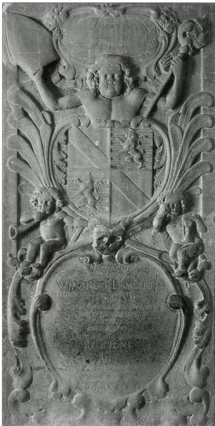
Afb. 9: Grafzerk van abt Winardus Lambertus †1664, 1699, abdijkerk Rolduc Kerkrade.