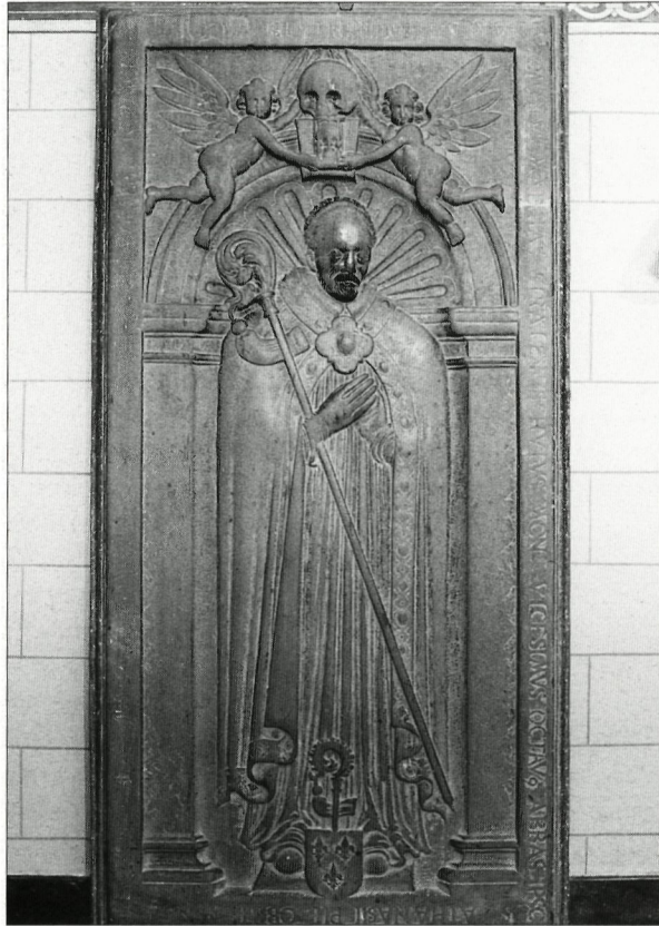
Afb. 6: Grafzerk van abt Mathias Straelen †1614, abdijkerk Rolduc Kerkrade.