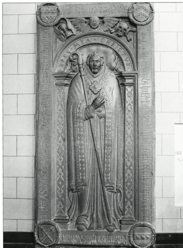
Afb. 5: Grafzerk van abt Joannes van Tomburg genaamd Wormbs †1600, abdijkerk Rolduc Kerkrade.

De figuur van de abt is staande afgebeeld met de benen iets uit elkaar en met de voeten naast het schild. De handen liggen gevouwen voor de borst, waarbij de linkerhand over de binnenzijde van de rechterhand is gelegd. Zijn hoofd rust op een kussen, dat aan de bovenzijde de boog volgt en waarvan de benedenhoeken eindigen in twee kleine kwastjes. De abt is gekleed in amict, albe en koormantel. De amict vertoont een versiering in ruitjes. Van de albe zijn slechts twee kleine gedeelten te zien, onder de amict en midden onder. De breed vallende mantel met rechts en links verschillende zware V- en U-plooien bedekt het hele onderlichaam. De bovenzijde van de mantel heeft sierranden bestaande uit ruiten en stippen, de onderzijden vertonen een franjerand. Achter de handen is het bovengedeelte van de gesp te zien die de mantel sluit. De abt is blootshoofds en heeft sluijk haar dat voor de oren afhangt. De abtsstaf wordt met de rechter onderarm tegen het lichaam gehouden. De krul, eindigend in een druiventros en met een ring als uiteinde, rust naast het hoofd op het kussen. De punt van de staf verdwijnt achter het wapenschild tussen de voeten, die gestoken zijn in schoenen met brede, vlakke neuzen.