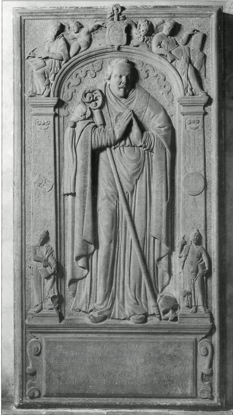
Afb. 8: Grafzerk van abt Casparus Duckweiler †1650, Johan Kronenburch 1639, abdijkerk Rolduc Kerkrade (foto RDMZ Zeist).