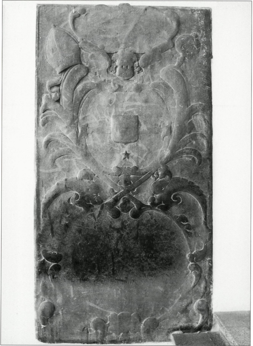
Afb: 10. Grafzerk van abt Petrus Melchers genaamd van der Steghe †1682, 1699, abdijkerk Rolduc Kerkrade.