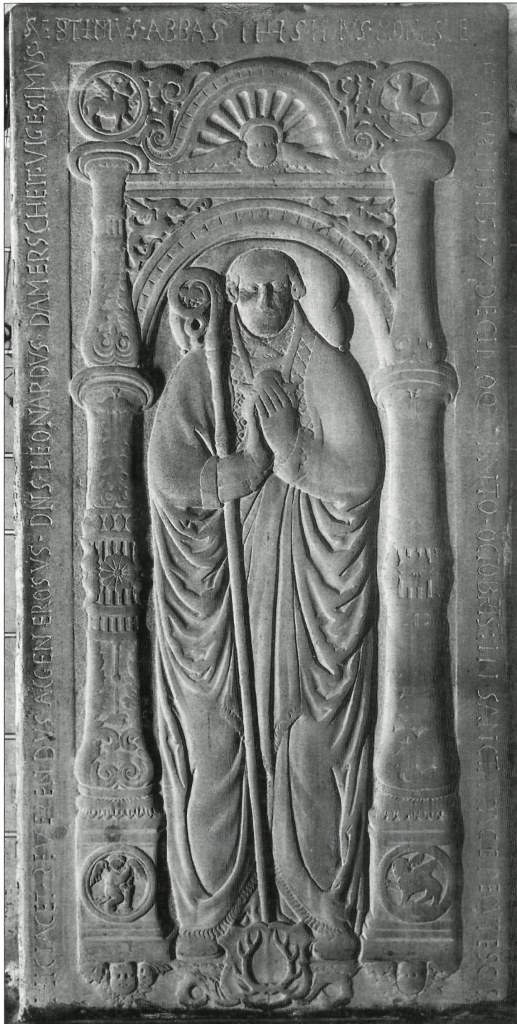
Afb. 4: Grafzerk van abt Leonardus Dammerscheidt †1557, abdijkerk Rolduc Kerkrade.