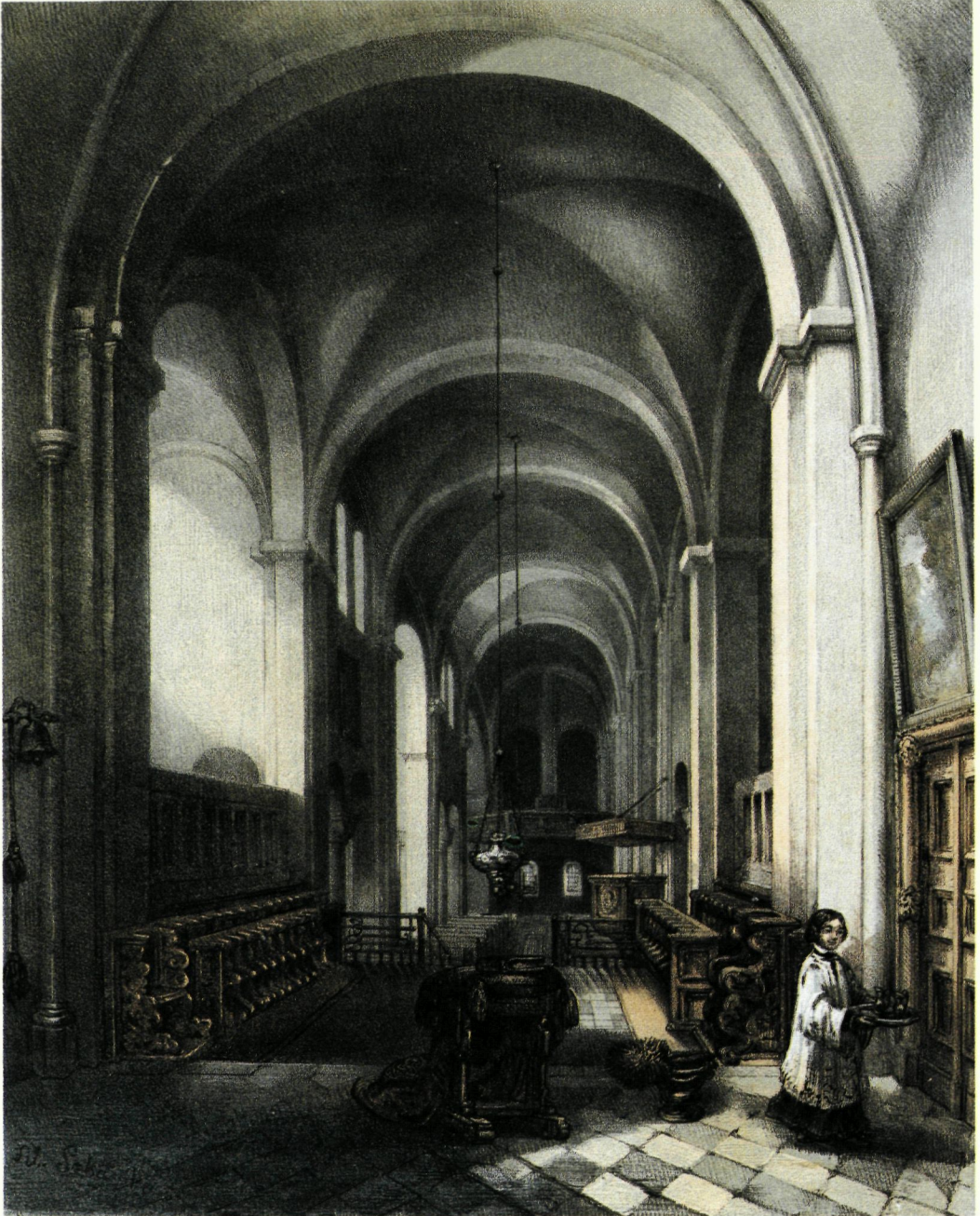
De abdijkerk van Rolduc in de negentiende eeuw. Gravure uit het album: Alexander Schaepkens, Rolduc et ses environs (1852).