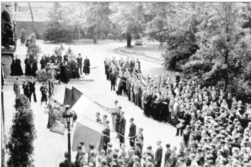
Een aubade in 1938.

Adieu, séjour de mon enfance Adieu, Rolduc, aimable lieu! Rolduc, où règnent l'innocence, La paix et le bonheur, adieu! Je pars pour consoler un père; Adieu, riant séjour des bois! Je suis au bout de ma carrière, Salut, pour la dernière fois! 6