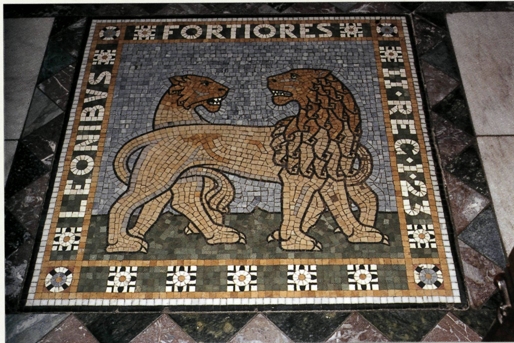
Motieven van het vloermozaïek.