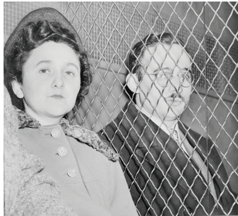
Afbeelding 1: Julius en Ethel Rosenberg terwijl ze de rechtbank verlaten, nadat ze schuldig zijn bevonden door de jury.