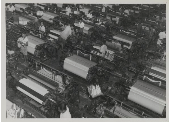
De weverij van de Java Textiel Maatschappij in Tegal.

en werd ook wel de 'Commissie-Menko' genoemd. In de zomer van 1934 vertrok de Textielcommissie naar Nederlands-Indië om de vestigingsmogelijkheden van katoenfabrieken te onderzoeken. 42 Later dat jaar werd na overleg tussen het Ministerie van Koloniën en de Textielcommissie besloten om een 'proeffabriek' te bouwen in Tegal, onder de naam Java