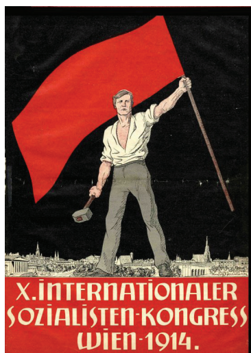
Afbeelding 1: Poster voorafgaande het 10e Internationale Socialistische Congres van de Tweede Internationale in Wenen, 1914, dat nooit heeft kunnen plaatsvinden.

Socialisme en antimilitarisme gingen vanaf 1889 hand in hand. 5 Parijs vormde het perfecte toneel om de link tussen vrede en socialisme te leggen. Honderd jaar eerder had er de Franse Revolutie plaatsgevonden en daarmee kreeg Frankrijk nu de kans om zich te bewijzen als stabiele staat.