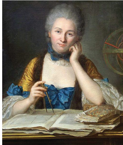
Afbeelding 1: Émilie du Châtelet, geschilderd door Maurice Quentin de La Tour (1704-1788). Op basis van dit portret werd Du Chatelet in januari dit jaar voor het eerst op een Franse postzegel gerepresenteerd.

Centraal in dit artikel staan de (veelal postuum gepubliceerde) geschriften van Émilie du Châtelet. Enerzijds is dit werk waarin zij reflecteert op haar positie als wetenschapper, haar vertaling van Mandeville's Fable of the Bees (geschreven rond 1735) en haar Discours sur le Bonheur (eerste uitgave: 1779). Anderzijds bespreek ik passages uit haar persoonlijke brieven waarin zij naar haar wetenschappelijke werk (met name haar vertaling van Newtons Principia