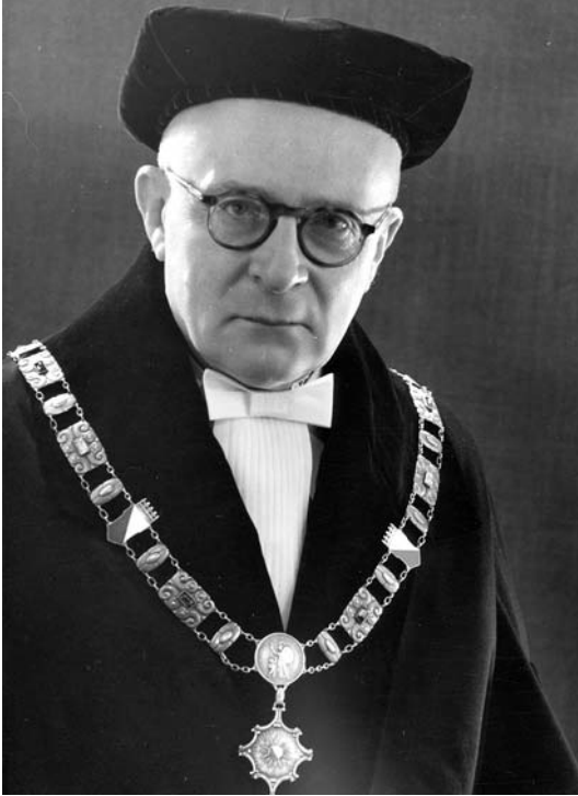
Portret Han C. Rümke

veel versnipperd is en hij pleit dan ook voor integratie. Deze integratie moet volgens hem plaatsvinden in de kliniek. Ten tweede waarschuwt hij voor overschatting van de psychiatrie: de psychiatrie heeft zijn grenzen. Voor de eclecticische clinicus Rümke biedt de literatuur een bron van kennis om inzicht te verkrijgen in het menselijk lijden en daarnaast lukt het de literatuur beter dan de wetenschappelijke psychiatrie om uitdrukking te geven aan het geestesleven. Hiermee is dit artikel een pleidooi om serieus aandacht te schenken aan de literaire belangstelling en aspiraties van Rümke – de psychiatrie en de literatuur zijn voor deze psychiater onlosmakelijk met elkaar verbonden. 9