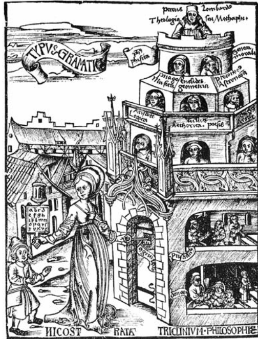
Figuur 1: De klassieke 'disciplines' verbeeld: de grammatica opent de deur naar het kasteel met de 'vrije kunsten'. Uit: Gregor Reisch, Margarita philosophica (Freiburg 1503).