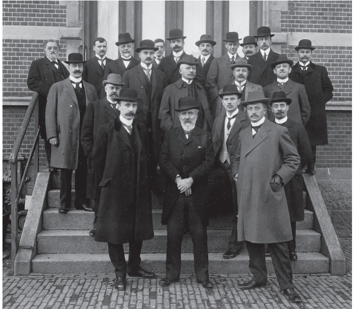
Eerste wetenschappelijke vergadering op 22 november 1913 te Amsterdam

De doelgroep van de vereniging bestond uit artsen, wiskundigen en natuurwetenschappers. Het bleek echter moeilijk het werkkerrein in een woord samen te vatten. Uit de opeenvolgende verschillende namen van het genootschap blijkt dat dit probleem nooit helemaal is opgelost. In de praktijk sprak men meestal kortweg van ‘de vereniging’, of later ‘het genootschap’. Een voorstel om de onhandige lange naam te vervangen door ‘Trias Historica’ werd in de ledenvergadering verworpen. Ik weet niet wanneer de afkorting ‘Gewina’ ingeburgerd is geraakt. Vanaf 1957 was er een nieuwsbrief die zo heette, maar wellicht werd de naam al eerder gebruikt. De afkorting past bij de naam die de vereniging vanaf 1938 had.