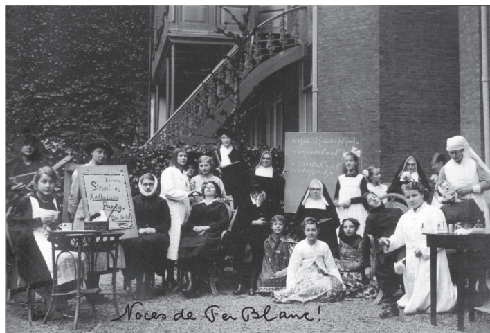
Fig. 1: (Leerlingen bij) Het Blikken Feest, 1920.

Plaats van handeling is de tuin van de school, Vondelstaat 35 te Amsterdam, waar in 1914 de eerste katholieke hbs voor meisjes werd gesticht.