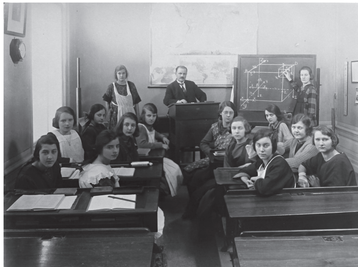
Fig. 2: Wiskundeles aan de Vondelstraat, 1924.

Nog vóór de Tweede Wereldoorlog wordt zij de eerste vrouwelijke redactrice van een katholieke krant. Zij verzorgt dan de vrouwenpagina van De Tijd . Later zal zij in interviews haar schooltijd typeren als een tijd van constant hard werken en de zusters als daadkrachtige en zelfbewuste vrouwen die meisjes wilden afleveren, die niet minder presteerden dan het mannelijk geslacht. 6