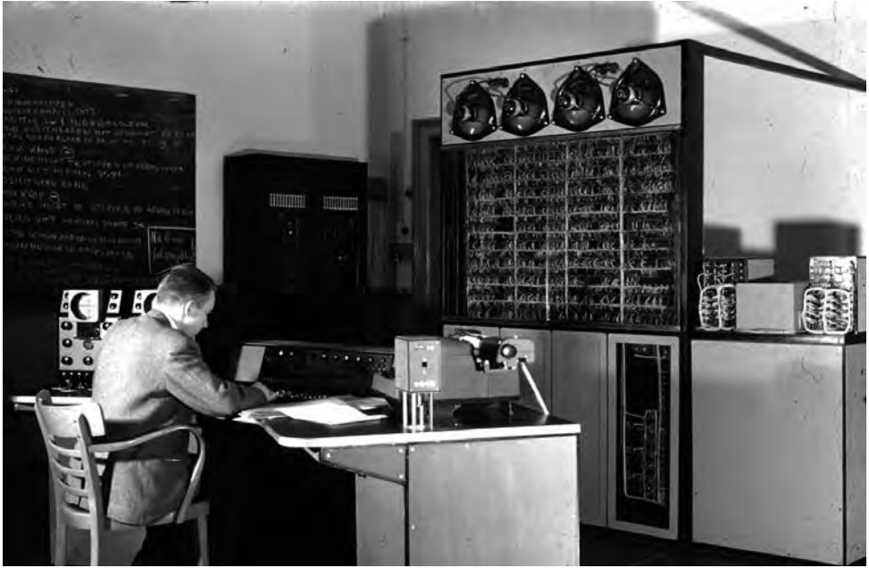
Gerrit A. Blaauw aan de console van de door hem ontworpen ARR A II, 1954

hadden opgegeven. ‘Ja, ongeveer twintig minuten,’ zegt Scholten bij terugblik op de vraag of Blaauw lang nodig had om hen te overtuigen van zijn inzichten in computerbouw. 22